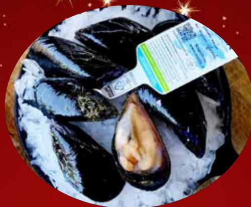
COZZA SPAGNA MITILLA 29