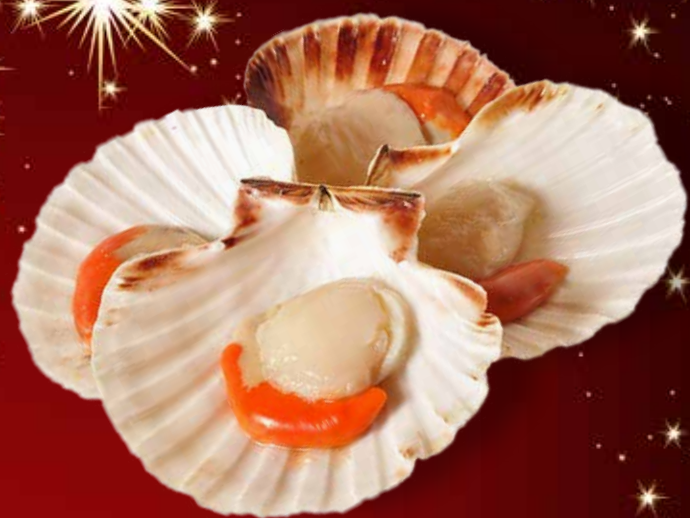
CAPPASANTA 1/2 GUSCIO DEC ATLANTICA