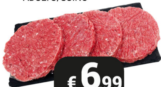
BURGER BOVINO ADULTO/SUINO