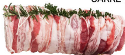
ARROSTO DI CARRE' SUINO