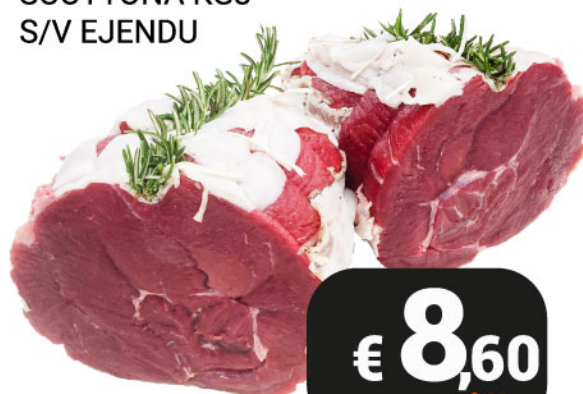
CAMPANELLO SCOTTONA KG3 S/V EJENDU