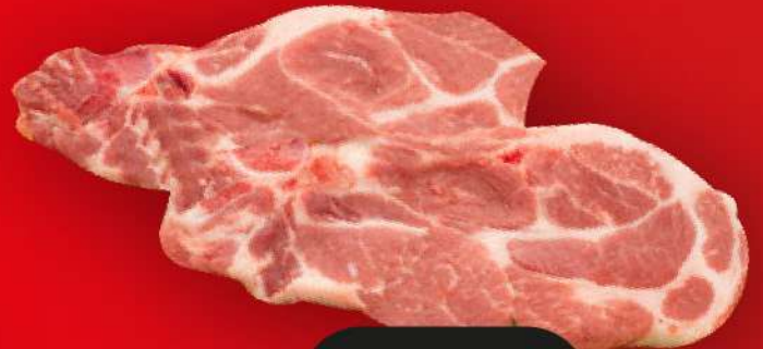
COPPA DI SUINO FETTE