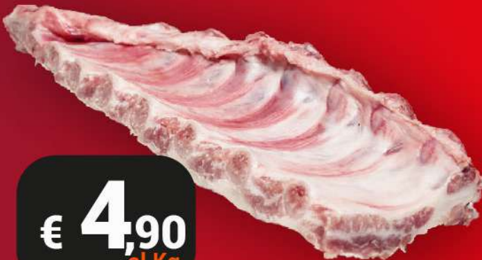
COSTINE DI SUINO