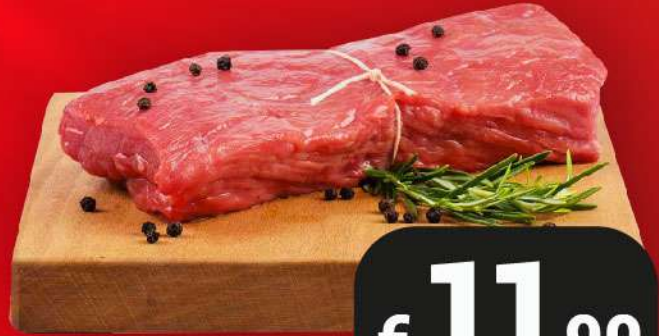
TAGLIATA DI SCOTTONA