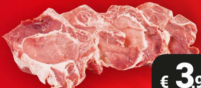
BRACIOLE DI SUINO